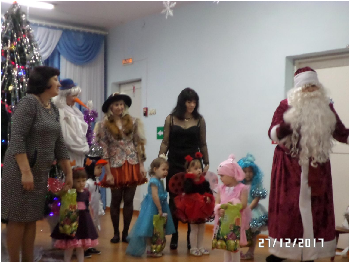
Утренник в группе «Сударушка»