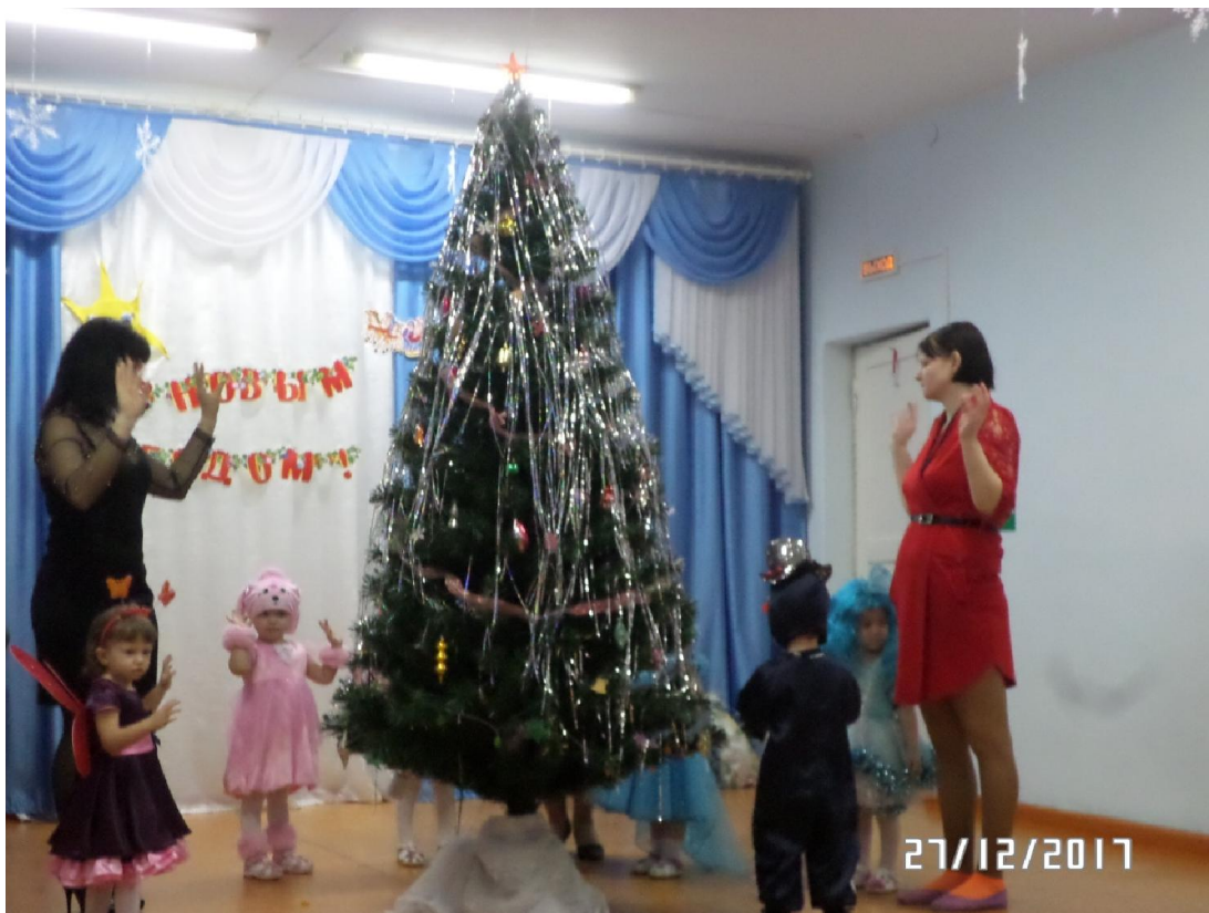
Утренник в группе «Карапуз»

В преддверии Нового года в детском саду прошли новогодние утренники во всех возрастных группах, которые погрузили воспитанников и их родителей в атмосферу сказки и чудес. Ребята, одетые в карнавальные костюмы, с удовольствием участвовали в играх и забавах, водили хороводы, танцевали, читали стихи и пели песни. Веселились от души. А для нас, сотрудников детского сада, лучший подарок к Новому году – это видеть счастливые глаза детей и благодарность родителей.